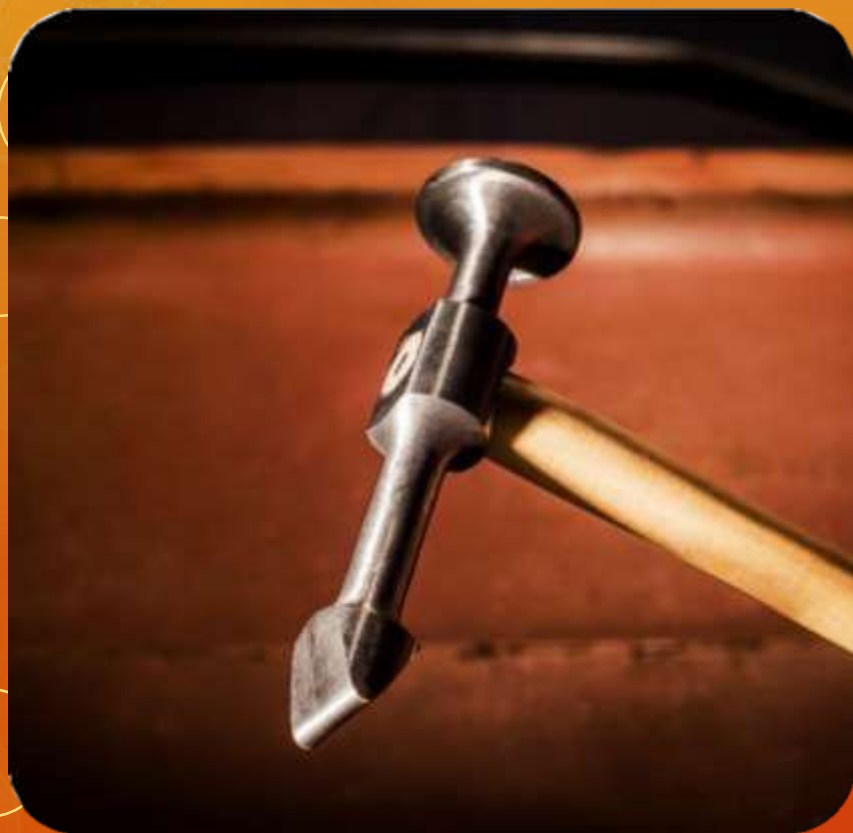
LARGO ARTICULO 110