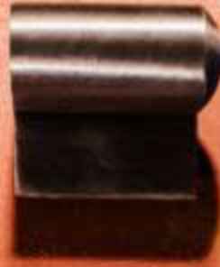
UNIVERSAL ART. 201