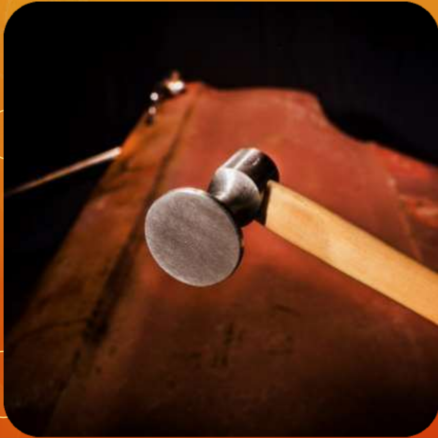
UNA MEDALLA ARTICULO 115