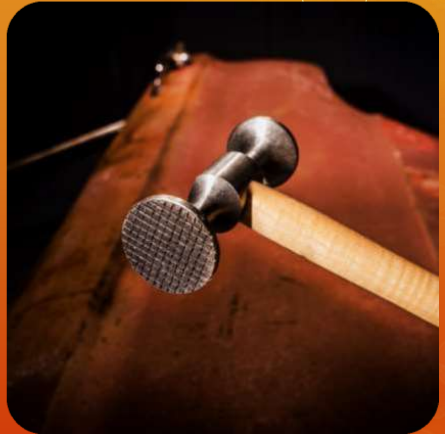
SEGRINADO ARTICULO 108