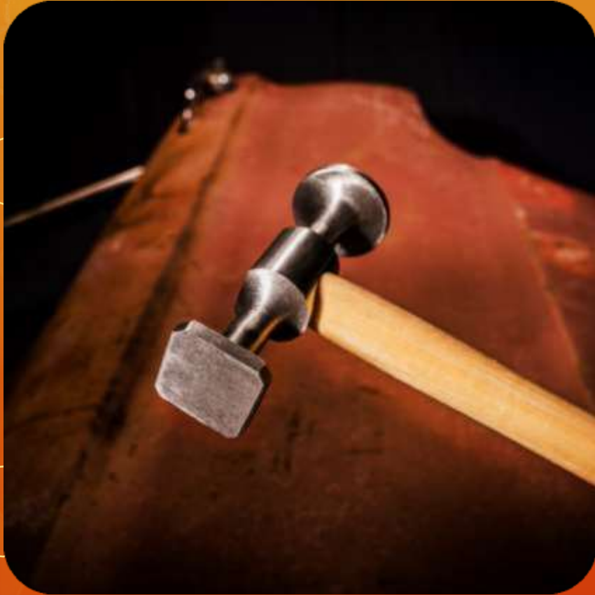
CUADRADO ARTICULO 109