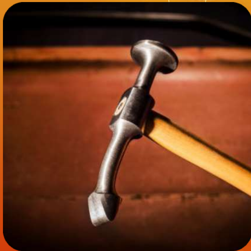
CIGUEÑA ARTICULO 112