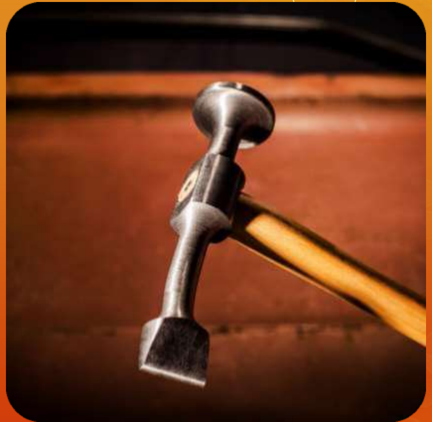
CIGUEÑA ARTICULO 113