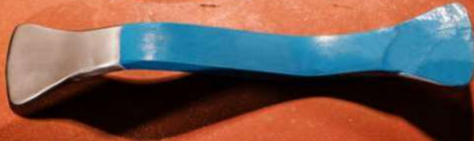
PALANCA ART. 304