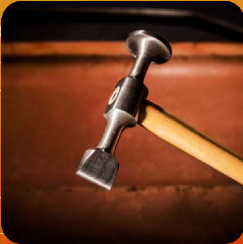
LIVIANO ARTICULO 103