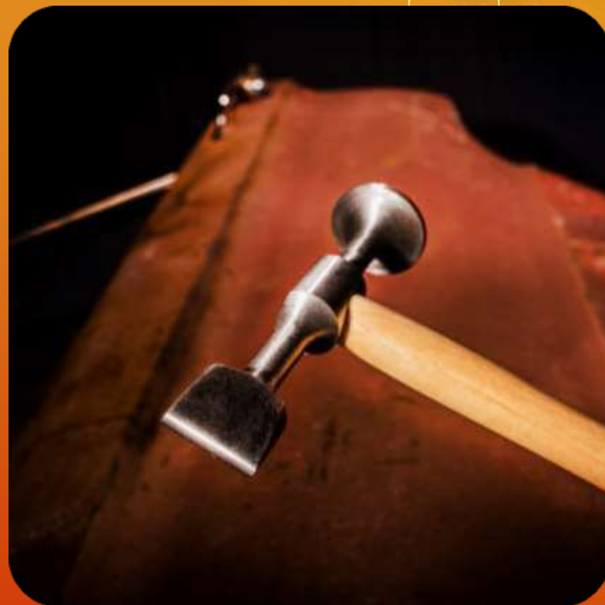
SUPER LIVIANO ARTICULO 121