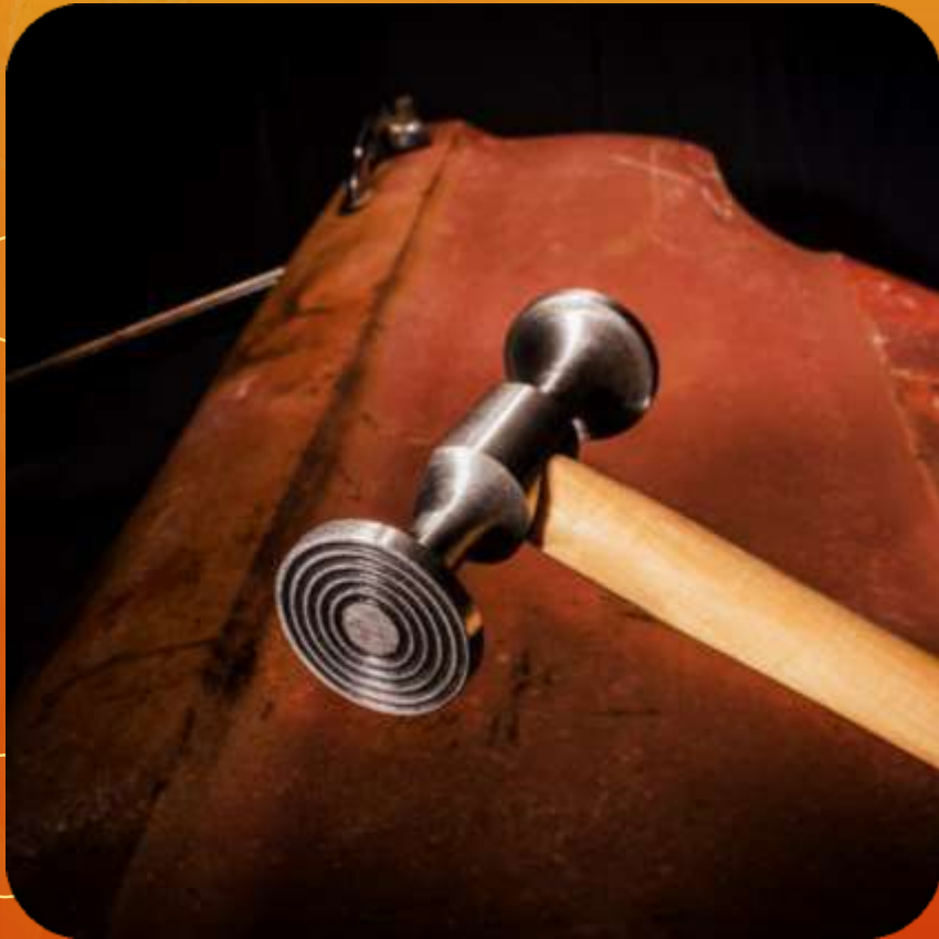
ESPIRAL ARTICULO 107