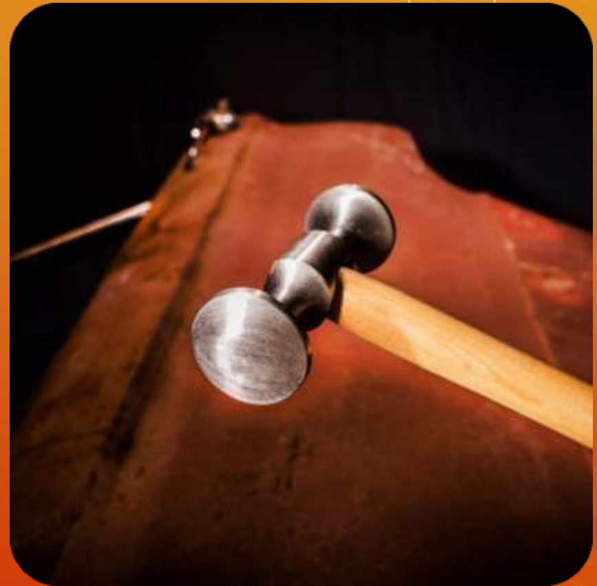
BOMBE ARTICULO 106