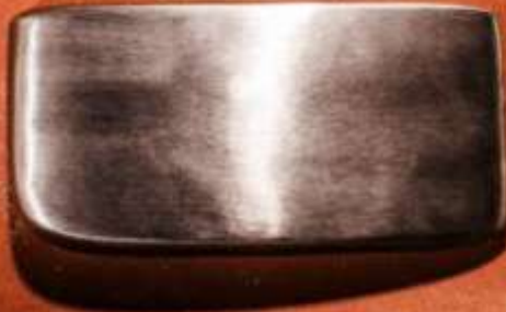
PLANITA ART. 202