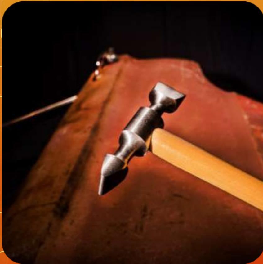
DOBLE PENA ARTICULO 105