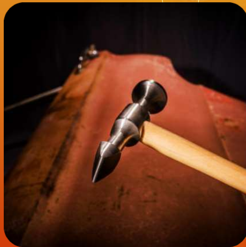
PESADO ARTICULO 102