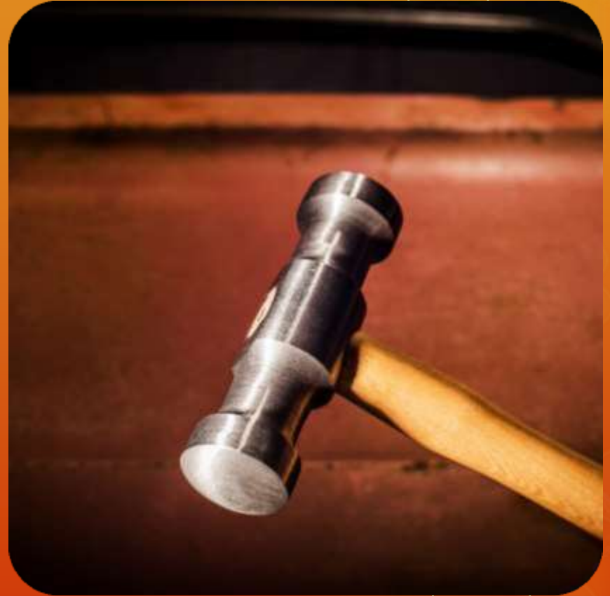
MEDIA MASA ARTICULO 114