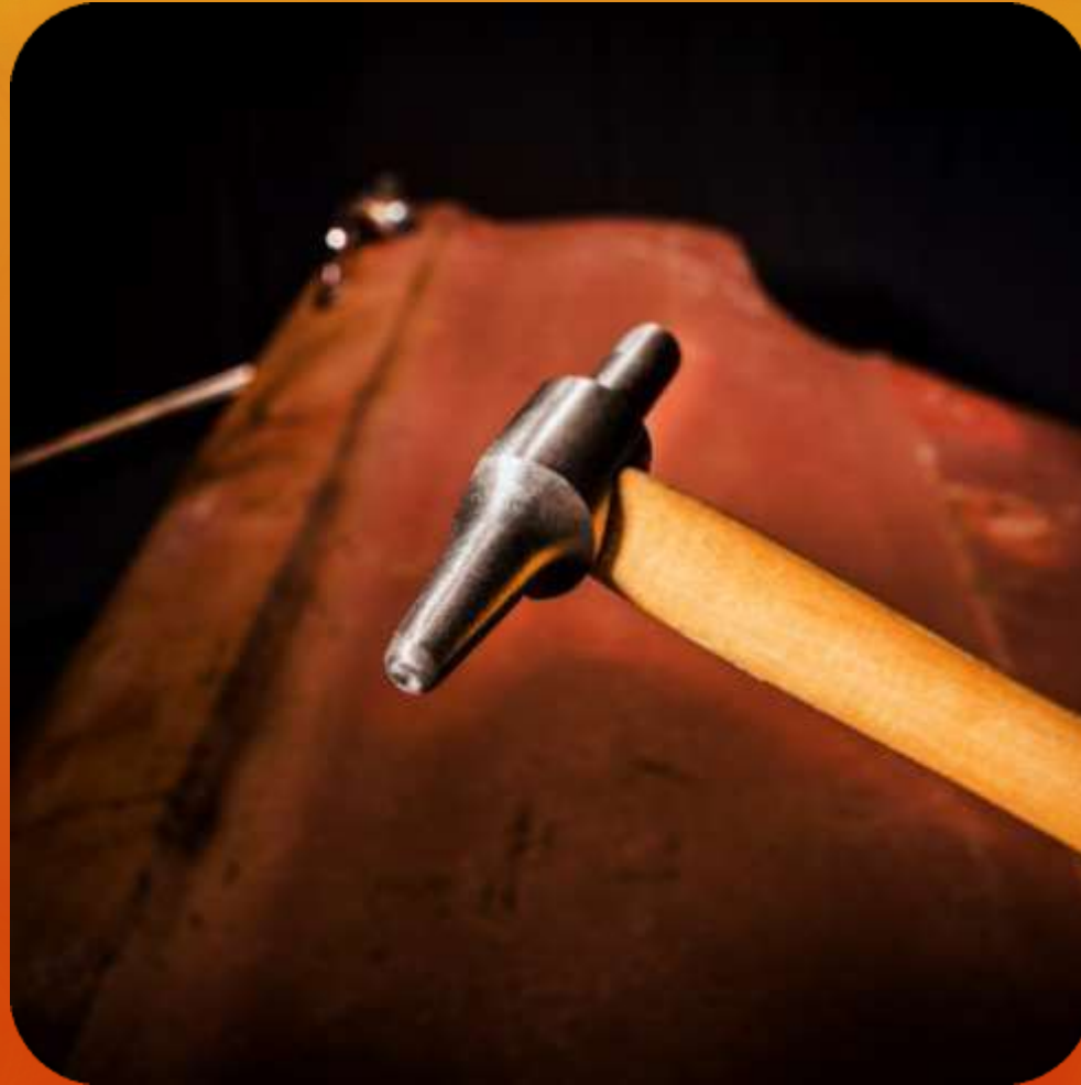
PUNTA ESFERICA ARTICULO 119