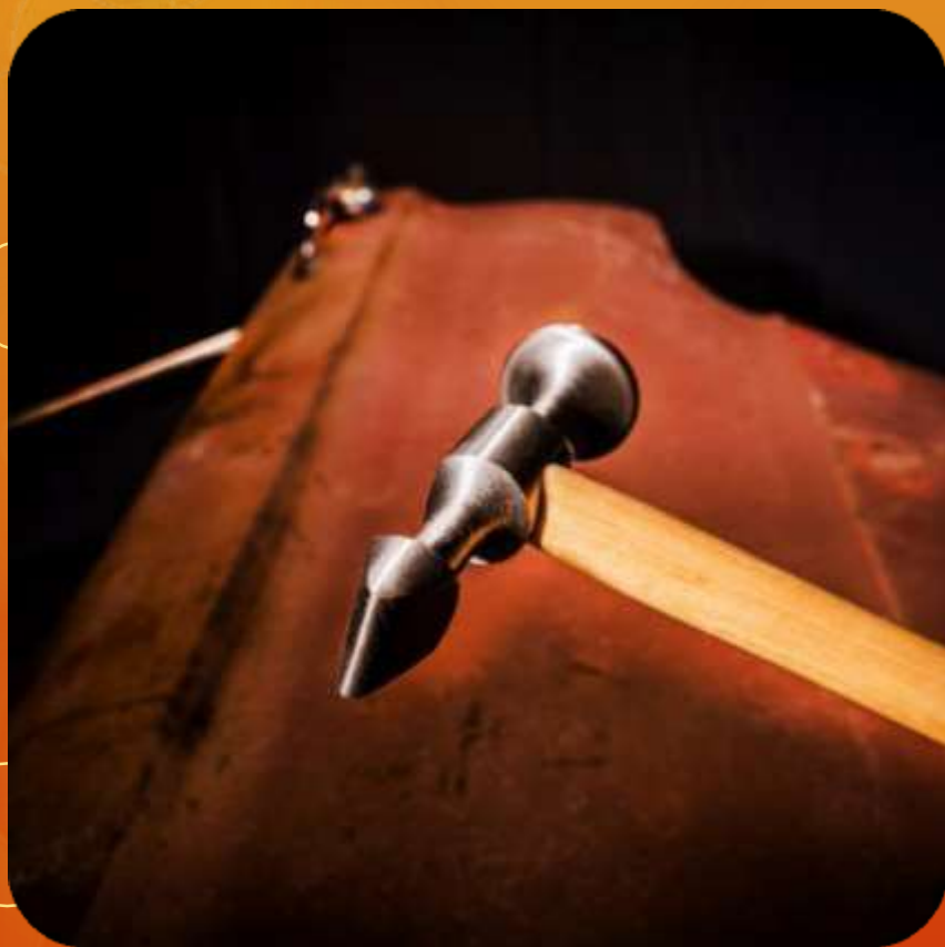
LIVIANO ARTICULO 101