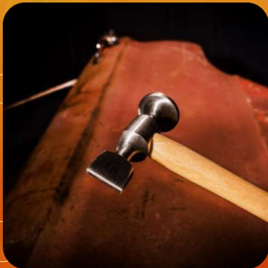
EXTRA CORTO ARTICULO 117