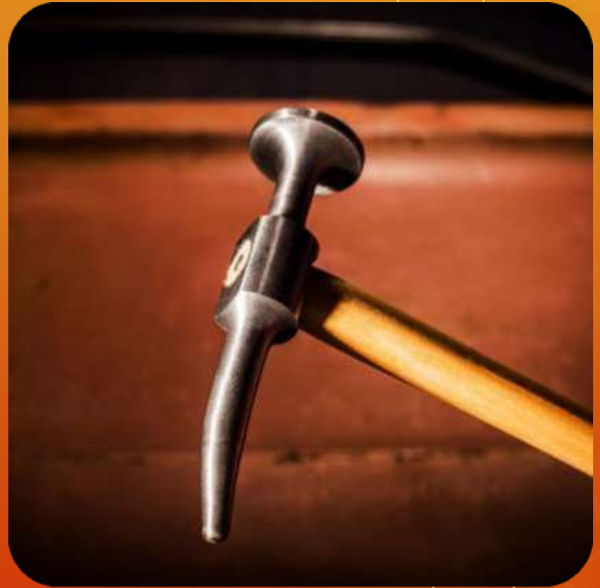
CIGÜEÑA ESFERICO ARTICULO 118