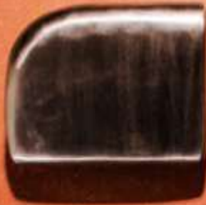
CONVENCIONAL ART. 203